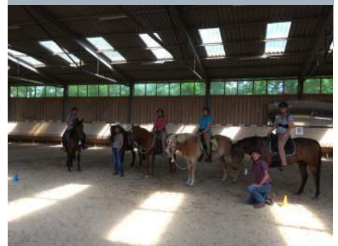
Reiten mit feineren Hilfen und weniger Ausrüstung