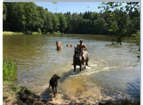
Spaß mit Pferden