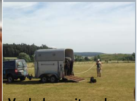
Verladen mit mehr Spaß und Herausforderung